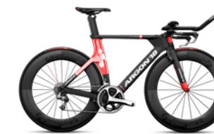
NOIR MAT / ROUGE LUSTRÉ

Vous savez ce prochain niveau, celui que peu de cyclistes réussissent à atteindre ? Le E-118 Next pourrait vous y mener. Dans un contre-la-montre, chaque détail compte et votre vélo joue un rôle primordial. Fleuron de notre gamme de contre-la-montre, ce modèle a été conçu spécialement pour pulvériser les secondes. Une arme fatale qui, une fois en de bonnes mains, pourrait bien anéantir les concurrents qui se trouvent sur son passage.